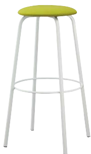
クッキースタンドWH 21771-E E/布・パルパ031