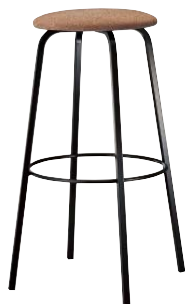
クッキースタンドBL 21770-E F/布・モコモ07