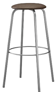
クッキースタンドAL 21769-E B/レザー・パロン07