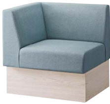
コンフル右アームWN1P W640 31320-4