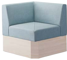
コンフルコーナー WN 31320-8