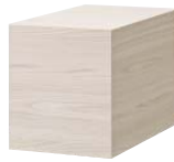
コンフルサイドテーブルWN W300 31320-S ¥49,800