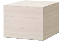
コンフルサイドテーブルWN W450 31320-M ¥59,800