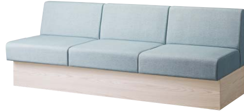
コンフルWN3P W1800 31320-3