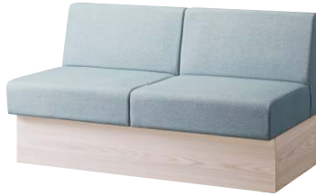
コンフルWN2P W1200 31320-2