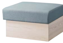
コンフルスツールWN W600 31320-9