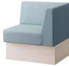
コンフル左アームWN1P W640 31320-5