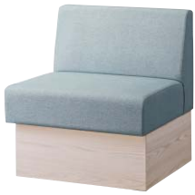
コンフルWN1P W600 31320-1 D/レザー・フロワ