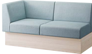
コンフル右アームWN2P W1240 31320-6