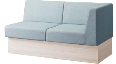
コンフル左アームWN2P W1240 31320-7