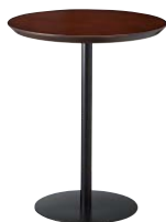
ST912 (BR) -T・AT166-A 600φ

天板 ¥57,000 脚部 ¥20,000 ベース:アルミ色塗装・AJ付 ボール:アルミ色塗装 (組立式)