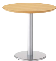
ST912 (NA) -S・AT118-B 750φ

天板 ¥57,000 脚部 ¥20,000 ベース:アルミ色塗装・AJ付 ボール:アルミ色塗装 (組立式)