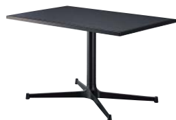
ST971 (BL) -M・ET611-A W1200・D750 天板 ¥70,600 脚部 ¥53,800 ベース:アルミ合金クロ塗装・AJ付 ボール:クロ塗装 (組立式)