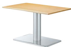
ST971 (NA) -M・BT321-K W1200・D750 天板 ¥70,600 脚部 ¥62,800 ベース:アルミ色塗装・AJ付 ボール:アルミ色塗装 (組立式)

反り止め金具 87003-X パイプ40×20・クロ塗装 1本 ¥6,400 (天板W1800用まで同値) ※W方向に取付けます。 ※天板と合わせてのご注文以外 は、送料を別途ご負担いた だきます。