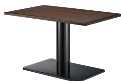
ST971 (BR) -M・BT322-K W1200・D750 天板 ¥70,600 脚部 ¥62,800 ベース:クロ塗装・AJ付 ボール:クロ塗装 (組立式)