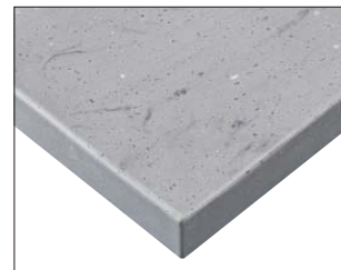
ST-993 (CN) 天板: 人工大理石

コンクリートの雰囲気をも人工大理石で再現。 実用性はもちろん、リアルな表情に仕上げました。