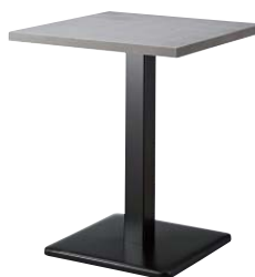
ST993 (CN) -E・BT301-R W600・D600 天板 ¥76,000 脚部 ¥25,000 ベース: クロ塗装・AJ付 ポール: クロ塗装 (組立式)