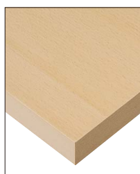
KT-720 (NA) 天板:突板/ブナ柾目 面材:突板/ブナ