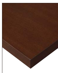
KT-720 (BR) 天板:突板/ブナ柾目 面材:突板/ブナ