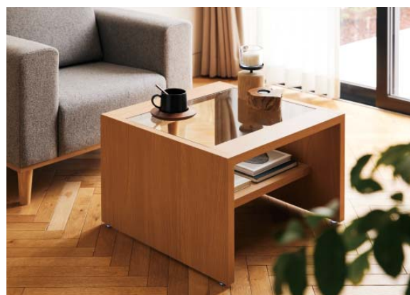
※ノファン P192をご覧ください。