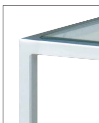
KT-766 (CL) 天板:8mm強化ガラス(透明)