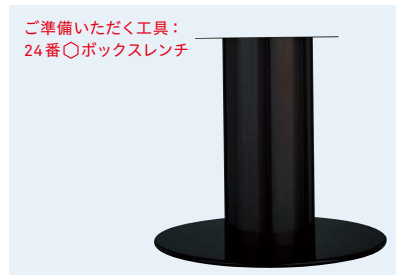
TABLE LEG 丸ベース