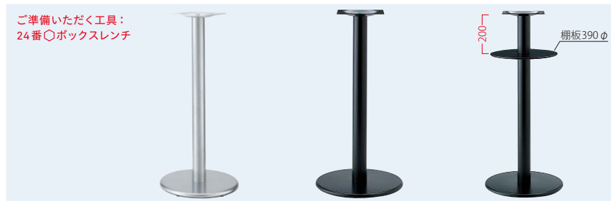
TABLE LEG ハイテーブル用