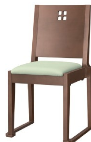
1126 室津D 椅子