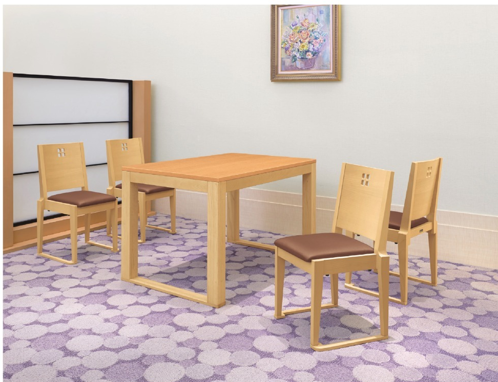
脚部 4370-4970 天板 9327-4027 H 長門IN ソリ付-長門 N テーブル W1200 × D750 × H700 mm 【P108 記載】 張地 / クレンスII L-6700 (A)