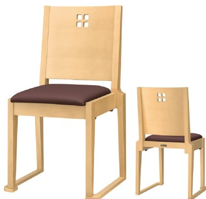
1026 室津N 椅子