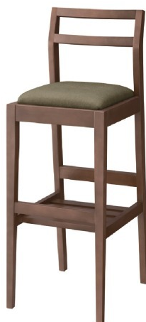
2175 伊東 D スタンド椅子 張地: デニムII UP-5376 (C)