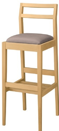
2075 伊東 N スタンド椅子 張地: シルキーラスタル UP-5243 (B)