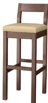
2166 小町 D スタンド椅子 張地: シルキーラスタル UP-5242 (B)