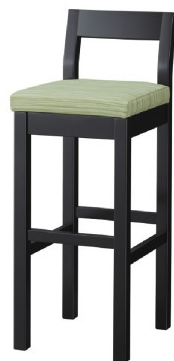
2266 小町 B スタンド椅子 張地: デコア L-6318 (C)

椅子は、025 ページをご覧ください。カウンター椅子は、103 ページをご覧ください。