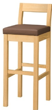
2066 小町 N スタンド椅子 張地: マニエラ L-6365 (C)