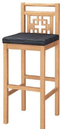
2040-2685 青島Nスタンド椅子 張地: デコア L-6321 (C)