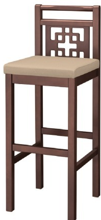
2140-2686 青島Dスタンド椅子 張地: マニエラ L-6359 (C)