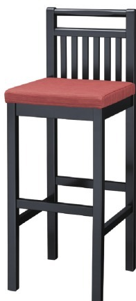
2340-2667 黒滝Bスタンド椅子 張地: デコア L-6315 (C)