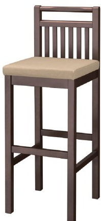
2140-2666 黒滝Dスタンド椅子 張地: マニエラ L-6359 (C)