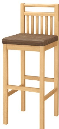
2040-2665 黒滝Nスタンド椅子 張地: デコア L-6320 (C)