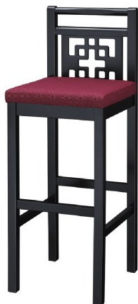
2340-2687 青島Bスタンド椅子 張地: 麻葉襲 UP-5473 (D)