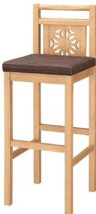
2040-2675 飛鳥 N スタンド椅子 張地：デコア L-6320 (C)