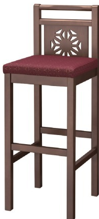
2140-2676 飛鳥 D スタンド椅子 張地：麻葉繫 UP-5473 (D)