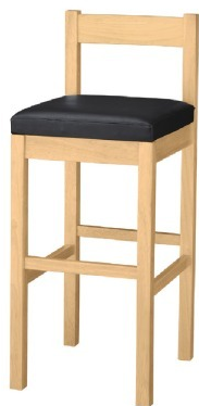
2015 千鳥 N スタンド椅子 張地：既製品（黒レザー）