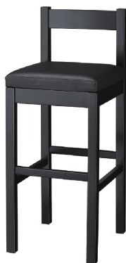
2315 千鳥 B スタンド椅子 張地：既製品（黒レザー）