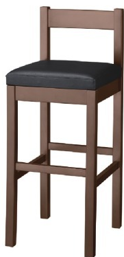
2215 千鳥 D スタンド椅子 張地：既製品（黒レザー）