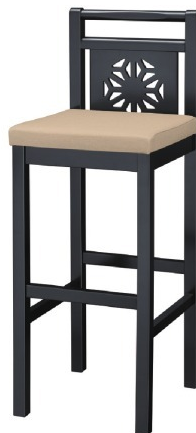
2340-2677 飛鳥 B スタンド椅子 張地：マニエラ L-6359 (C)