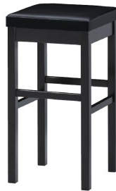
2395-1841 天竜B スタンド椅子 張地: 黒レザー (既製品)