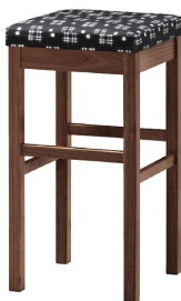
2195-1840 天竜D スタンド椅子 張地: カスリレザー (既製品)