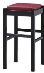
2393-1739 弥山B スタンド椅子 張地: 赤レザー (既製品)