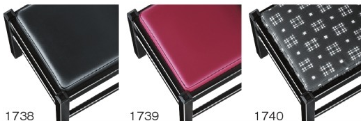
1738 黒レザー (既製品) 張地: オールマイティ L-6562 1739 赤レザー (既製品) 張地: オールマイティ L-6595 1740 カスリレザー (既製品) 張地: カスリ