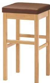
2095-1839 天竜N スタンド椅子 張地: 茶レザー (既製品)