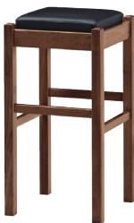
2193-1738 弥山D スタンド椅子 張地: 黒レザー (既製品)