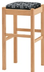
2093-1740 弥山N スタンド椅子 張地: カスリレザー (既製品)