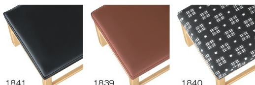
1841 黒レザー (既製品) 張地: クレンズII L-6702 1839 茶レザー (既製品) 張地: クレンズII L-6700 1840 カスリレザー (既製品) 張地: カスリ