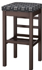
2150-1840 伊賀D スタンド椅子 張地：カスリレザー（既製品）