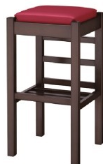
2152-1739 葛城D スタンド椅子 張地：赤レザー（既製品）