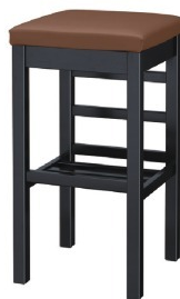
2350-1839 伊賀B スタンド椅子 張地：茶レザー（既製品）