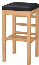
2050-1841 伊賀N スタンド椅子 張地：黒レザー（既製品）