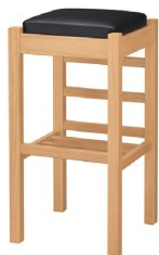
2052-1738 葛城N スタンド椅子 張地：黒レザー（既製品）