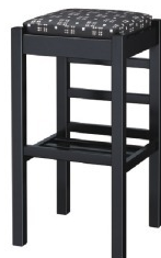
2352-1740 葛城B スタンド椅子 張地：カスリレザー（既製品）