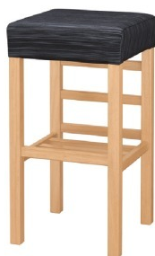
2054 宮滝N スタンド椅子 張地：デコア L-6321 (C)