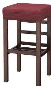
2154 宮滝D スタンド椅子 張地：デコア L-6315 (C)