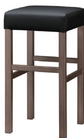
2133 保津D スタンド椅子 張地：クレنزⅡ L-6702 (A)