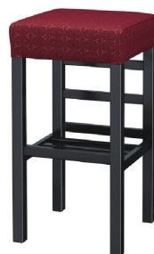
2354 宮滝B スタンド椅子 張地：麻葉襲 UP-5473 (D)