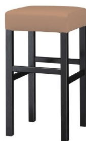
2233 保津B スタンド椅子 張地：クレنزⅡ L-6697 (A)