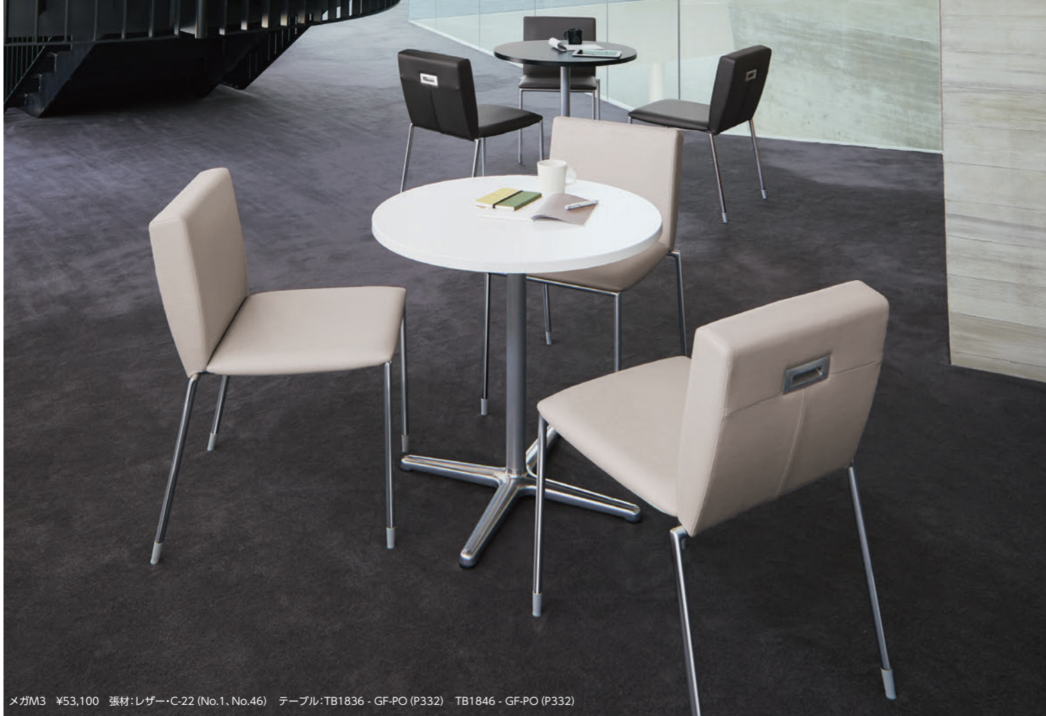
メガM3 ¥53,100 張材:レザー-C-22 (No.1, No.46) テーブル:TB1836 - GF-PO (P332) TB1846 - GF-PO (P332)