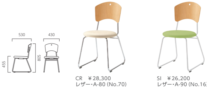
CR ¥28,300 レザー-A-80 (No.70) SI ¥26,200 レザー-A-90 (No.16)