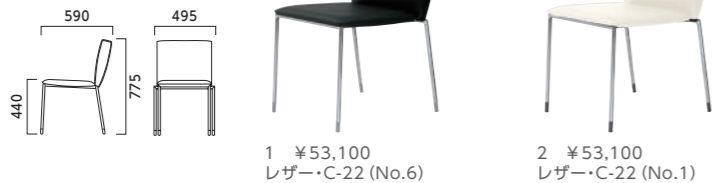
1 ¥53,100 レザー-C-22 (No.6) 2 ¥53,100 レザー-C-22 (No.1)