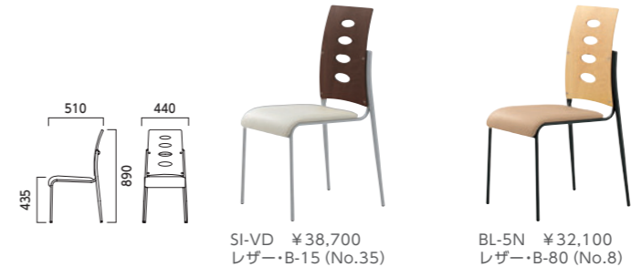
SI-VD ¥38,700 レザー-B-15 (No.35) BL-5N ¥32,100 レザー-B-80 (No.8)