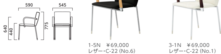
1-5N ¥69,000 レザー-C-22 (No.6) 3-1N ¥69,000 レザー-C-22 (No.1)