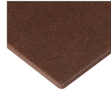
ナチュラル (クリア塗装)