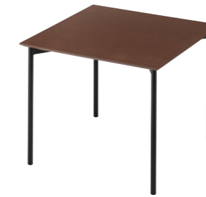
TB3300 - LV-900D ¥156,900 900W 900D 715H 天板:¥93,700 脚部:¥63,200 ▶P.357