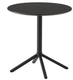
TB3316 - GR-DG ¥132,000 750φ 715H 天板:¥87,300 脚部:¥44,700 ▶P.356