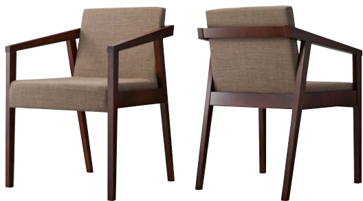
イッソウイスBR 11909-A D/布・エイガT-9204