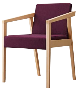
イッソウイスNA 11908-A F/布・ラット2010