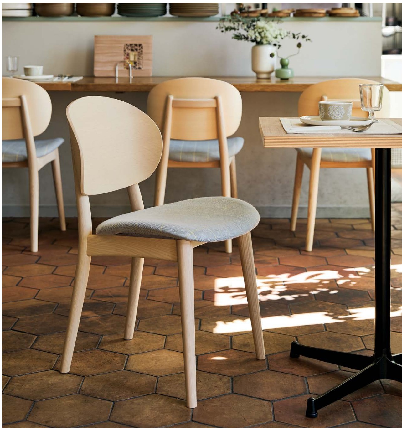
Table : Top ▶ P321 / Leg ▶ P345