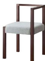
ピラー左アームイスBR 11865-A B/布・クラックS-3 塗装色：BR