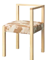
ピラー左アームイスNA 11863-A F/レザー・ウィックリー2 塗装色：NA