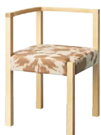
ピラー右アームイスNA 11862-A F/レザー・ウィックリー2 塗装色：NA