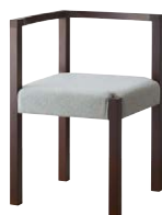
ピラー右アームイスBR 11864-A B/布・クラックS-3 塗装色：BR