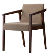
イッソウイスBR 11909-A C/布・エイガT-9204 塗装色：BR