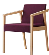
イッソウイスNA 11908-A D/布・ラット2010 塗装色：NA