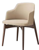
ルシアイスBR 11944-A C/レザー・ゼラファイト・プロL-6480 塗装色：BR