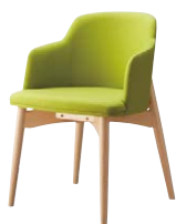
ルシアイスNA 11943-A D/布・バルバ031 塗装色：NA