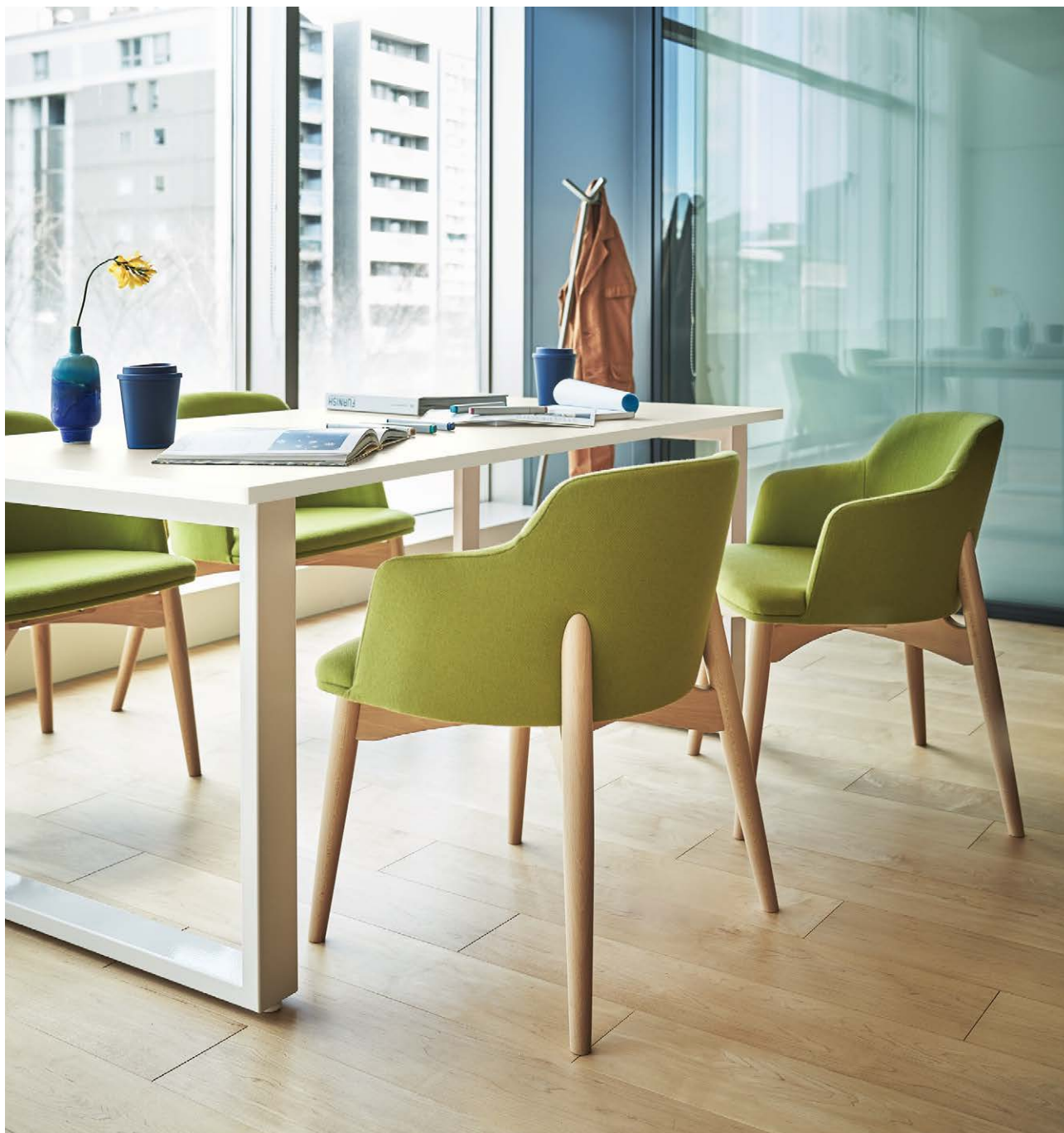
Table : Top ▶ P324 / Leg ▶ P341