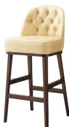
ガレルスタンドBR 11795-E B/レザー・サンセブンL-6742 塗装色：BR