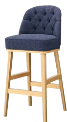
ガレルスタンドNA 11794-E D/布・カルドツイードII 05 塗装色：NA