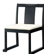
錦イスA (黒) 50554-A A/レザー・メトロ350 塗装色：黒