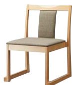
錦イスB (白木) 50555-A C/布・エイガT-9202 塗装色：白木