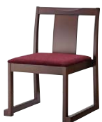
錦イスA (茶) 50553-A D/布・ベベル6 塗装色：茶