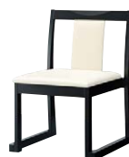
錦イスB (黒) 50557-A A/レザー・メトロ350 塗装色：黒