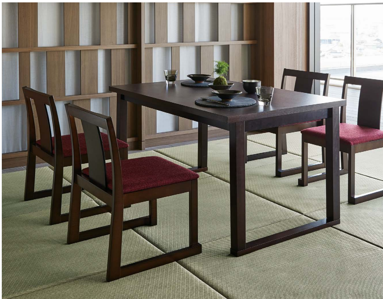
Table ▶ P294