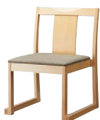
錦イスA (白木) 50552-A C/布・エイガT-9202 塗装色：白木