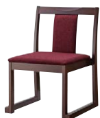
錦イスB (茶) 50556-A D/布・ベベル6 塗装色：茶