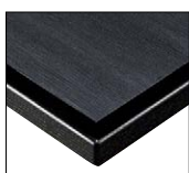
(BL) 天板:メラミン化粧板/ TJ-88KQ98 面材:アッシュ