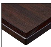
(BR) 天板:メラミン化粧板/ TJ-293KQ98 面材:アッシュ