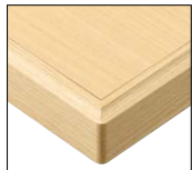
(NA) RENEWAL 天板:メラミン化粧板/ JC-568K 面材:アッシュ