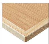
(NA) 天板:メラミン化粧板/ JC-2016K 面材:アッシュ