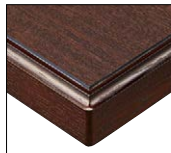
(BR) 天板:メラミン化粧板/ TJ-301KQ98 面材:アッシュ