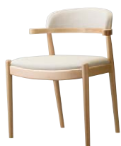
ブリーズイスNA 11985-A C/レザー・フロワ1