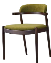
ブリーズイスBR 11986-A E/布・モコモ08