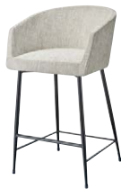
ロイクスタンドBL 21866-E D/布・ドルチェ03 塗装色：BL