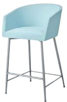
ロイクスタンドSG 21865-E C/レザー・ゼラファイト・プロL-6472 塗装色：SG